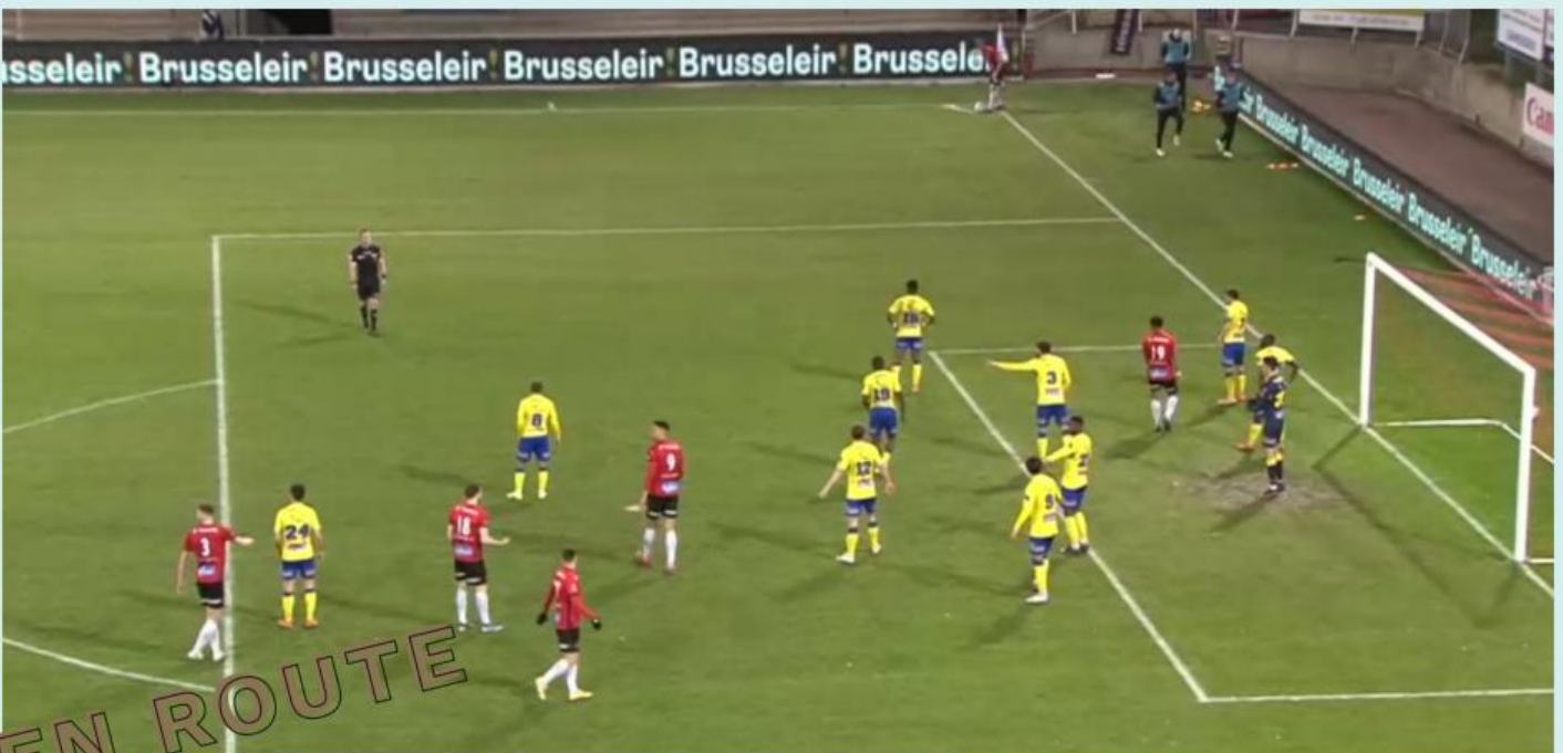
20/2/2021 - Stadion RWDM

De Brusselse plooge zaain er feer op! Brusseleir stond op de varëskes van de speilers en op et veld van den RWDM. En nen dag loêter uuk bei den Anderlecht!