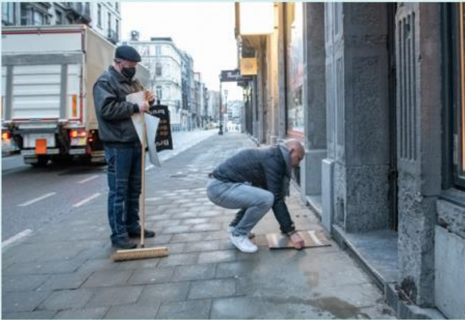
15/2/2021 - Brussel Plekploogen in akse! Alleman mag weite dat em garriveid es!